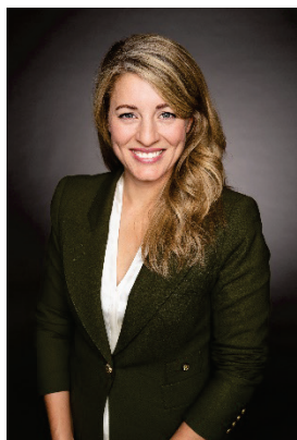
L'honorable Mélanie Joly Ministre du Développement économique et des Langues officielles, et Ministre responsable de Diversification de l'économie de l'Ouest Canada

Dans ces pages, vous trouverez plus d'informations sur les priorités de DEO et sur notre engagement à les mettre en œuvre, alors que nous travaillons avec les gens de l'Ouest pour un avenir plus prospère.